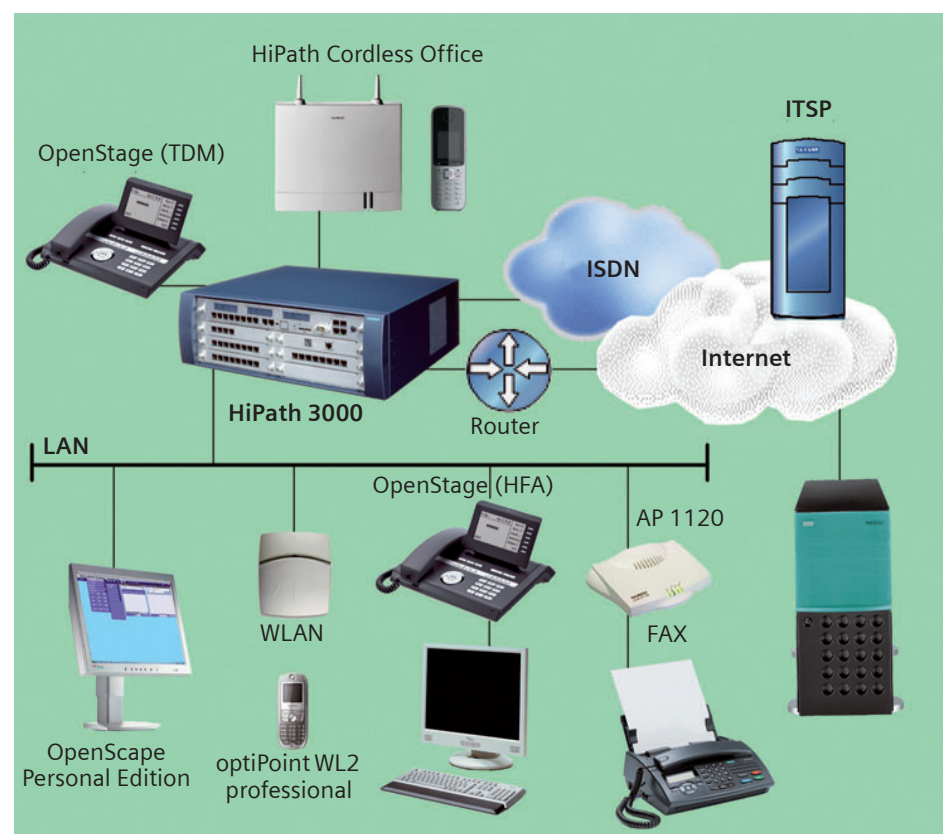
IP-Kommunikationsfunktionen über die HG 1500 in einem HiPath 3000-Standalone-Szenario